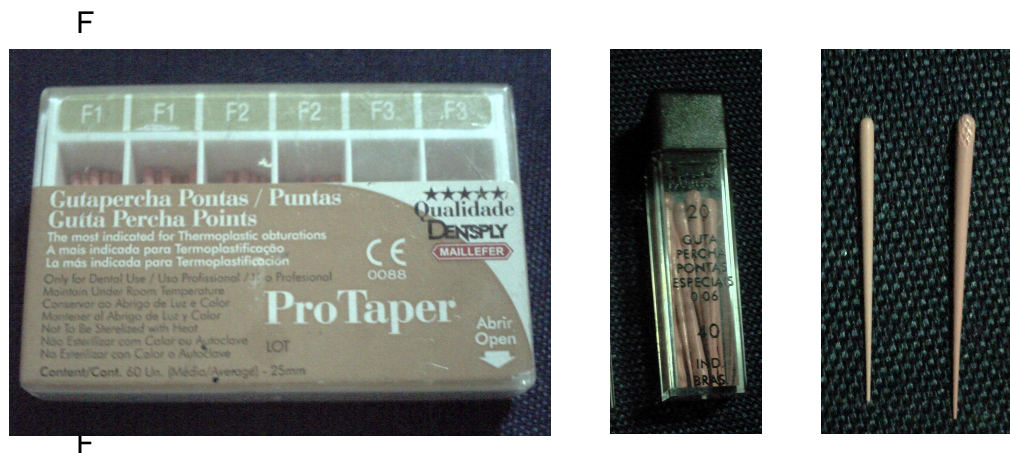
Figura 1 – Cones F3 ProTaper e cones de guta percha especiais # 40 0.06 respectivamente

Após 72h os dentes foram cortados em três terços iguais no sentido cérvico apicais (figuras 3 e 4)