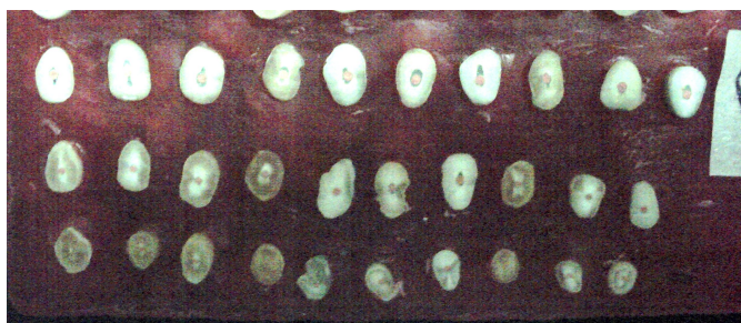
Figura 3 – Cortes do cone 0.06 = G2